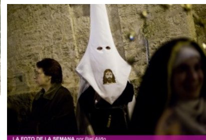
LA FOTO DE LA SEMANA por Eiel AAVV

Ciertamente, la entrada en escena de dicha entidad bancaria no se esperaba, pero una empresa en quiebra había saldado su deuda con ésta mediante la entrega de unos terrenos, los cuales también